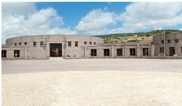
Centro Giovanni Lilliu - Barumini